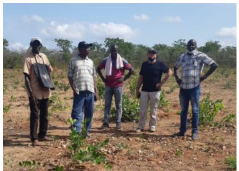
Site de la centrale