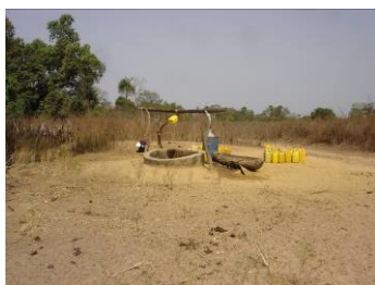
Puits à Thiendien