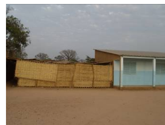
Collège d'enseignement moyen

➤ Visite de Suelle avec l'ensemble des représentants du village. ( Samedi 21 février ).