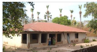
Case de santé actuelle en cours de démolition

La case de santé de Diattang s'intègre dans un projet jeune qui aura lieu en juillet 2009. Le voyage de février devait nous permettre de finaliser ce projet de construction ( choix d l'entrepreneur, validation du devis...). Les différents contacts et échanges décrits ci-dessous auront permis de cerner l'attente du village et de recueillir toutes les informations nécessaires pour compléter le dossier.