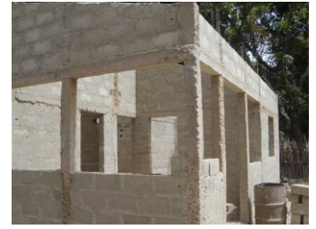
Case de santé en construction