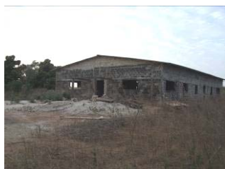
Foyer des jeunes