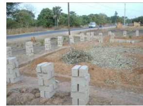
Construction classe CEM