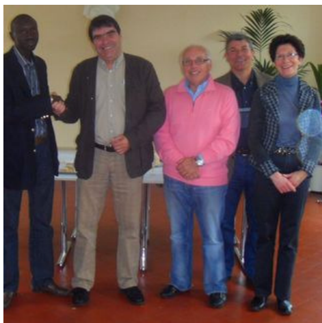
Réception à Bazainville